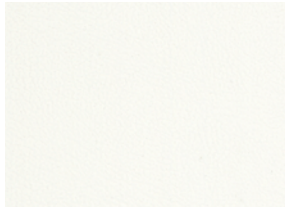
Marble Mármol F4357-10120